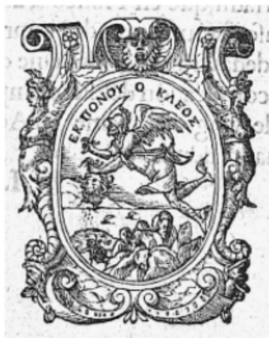
Marque typographique Imprimé à Lyon par Bonhomme, Macé en 1552 Technique : Taille d'épargne

Devise : ΕΚ ΠΟΝΟΥ Ο ΚΛΕΟΣ (Par le travail, la renommée)